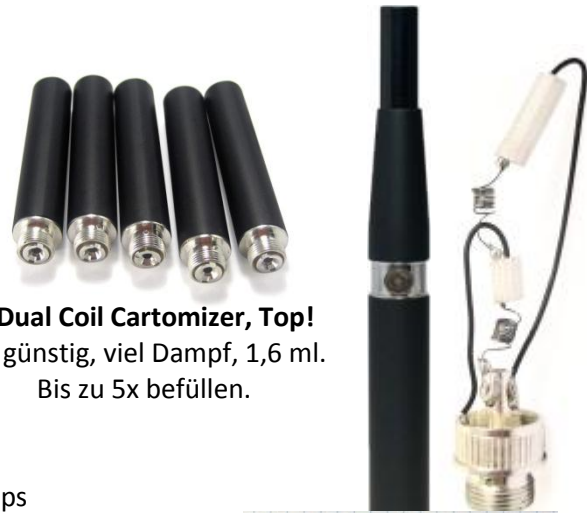
Dual Coil Cartomizer, Top! Sehr günstig, viel Dampf, 1,6 ml. Bis zu 5x befüllen.